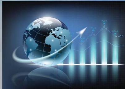
Bachillerato Bie de Ciencias Sociales