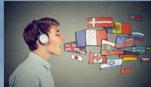
Bachillerato Bie de Idiomas

Refuerza una de las áreas del Bachillerato (en nuestro caso, los Idiomas) por lo que puede realizarse desde cualquier modalidad de Bachillerato: Ciencias, Sociales y Humanidades