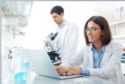
Bachillerato Bie Científico

Vinculado a una de las modalidades de Bachillerato; sólo puede cursarse desde esa modalidad